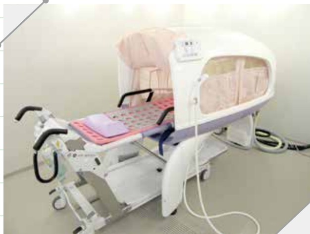
ストレッチャー浴