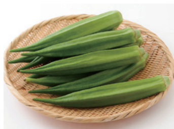
栄養科 管理栄養士 宮川 結衣