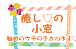
職員のウチの子を紹介します！

OPAMは建物自体も魅力的。「五感のミュージアム」「出会いのミュージアム」をコンセプトにガラス張りですぐに開かれた居心地の良い素敵な美術館です。ぜひ出かけてみてください。