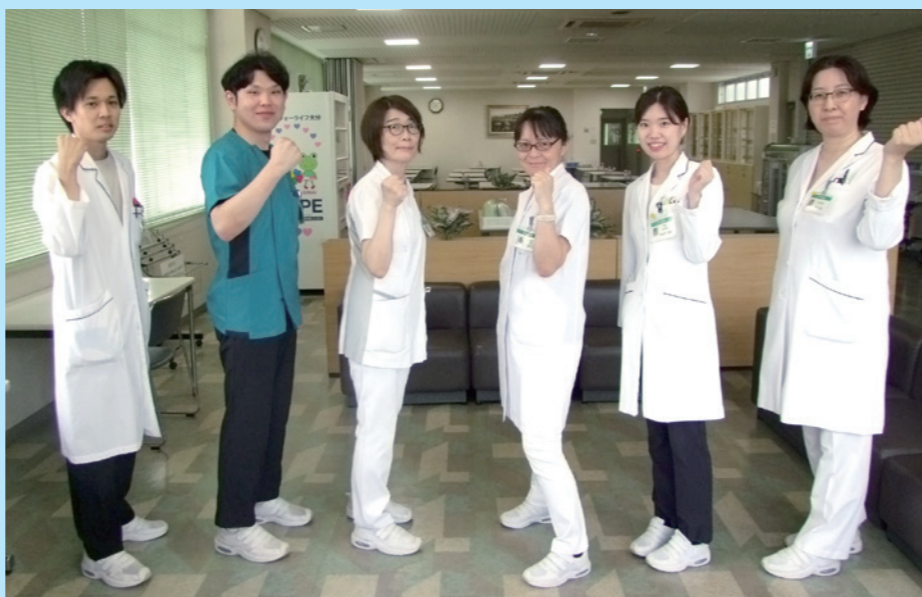
2023年度糖尿病委員メンバー