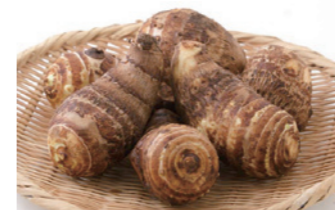
栄養科 管理栄養士 山鼻 有夏