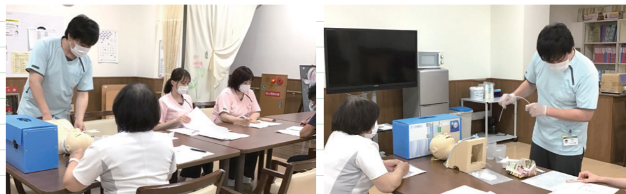
毎月第3木曜日に吸引・胃ろうが必要な方の技術研修を行なっています。