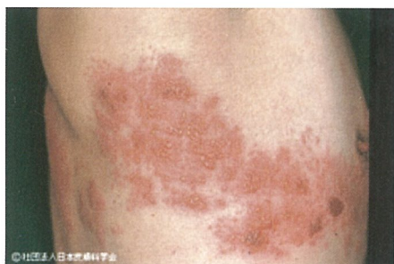
右体幹の带状疱疹

带状疱疹は、体幹（胸や背中）にできることが多いのですが、全身どの部位にも発症します。眠れないほどの痛みや痒みに悩まされるだけでなく、顔面に行くと顔面神経麻痺をきたしたり、聴力や視力が障害されたり、稀ですが髄膜炎を合併することもあります。带状疱疹になったらできるだけ早く治療を始めることが大切です。