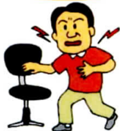
図1 シオーピーデーの症状